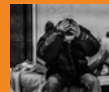
De Wereld is ziek P.10