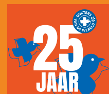
25 jaar P.4